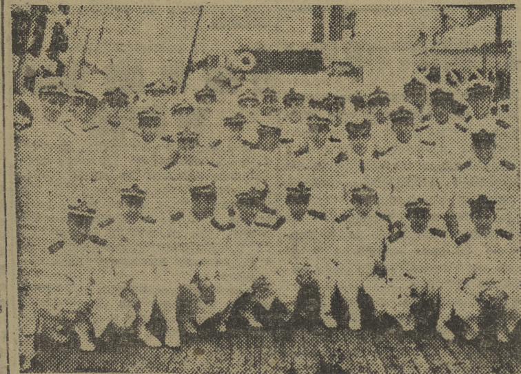
CADETES NAVALES ESPAÑOLES EN BUENOS AIRES