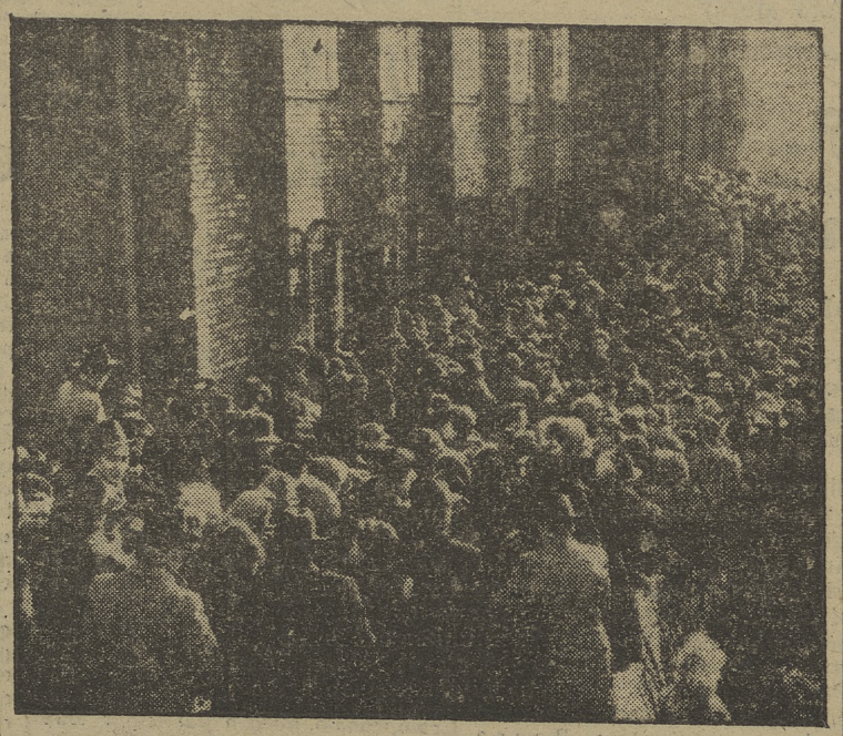
BERLIN. — He aquí un grupo de los 5.000 huidos de la zona rusa refugiados en el sector Oeste de esta capital ante una de las oficinas de registro. Esta cifra de ahora es la máxima alcanzada desde que comenzó la huida en masa de aquellos que malvivían tras el telón de acero. En febrero pasado se habían registrado 41.000 refugiados.