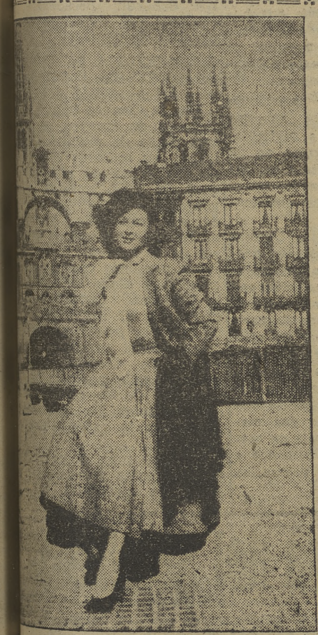
Wayward estaba ayer aún en Burgos. Por la mañana visitó la Catedral. Hela aquí con nuestro monumento al fondo, sorprendida por la obra de Villafranca. Hacia el mediodía la estrella cinematográfica marchó a Madrid

B ANGKOK, 11. — El ministro de Asuntos Exteriores español, don Alberto Martín Artajo, ha salido en avión con dirección a Karachi, después de una breve estancia en la capital del reino de Tailandia. (Efe).