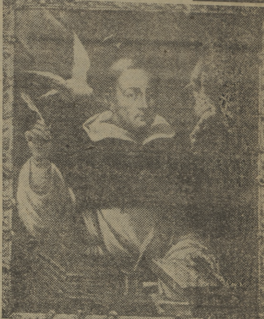
Santo Tomás de Aquino, Patron de los estudiantes, cuya fiesta celebramos hoy.