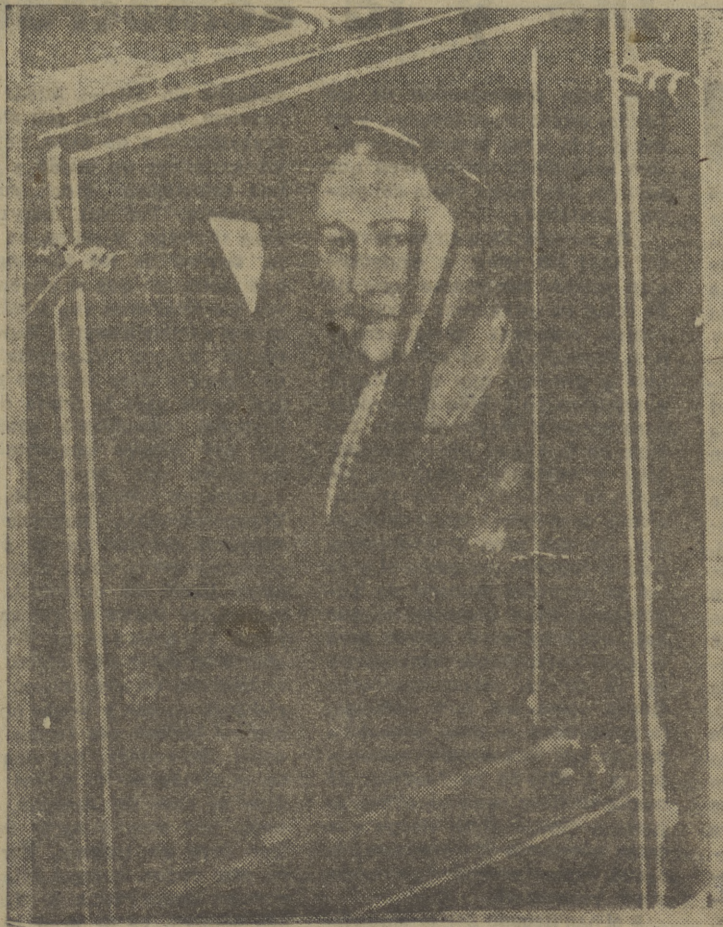
La reina madre, Isabel, en el coche en el cual seguía los restos mortales del rey Jorge VI.

El 21 de septiembre el duque había llegado “a algún lugar de Francia”. Fue alojado en un castillo y mezclado con generales y coroneles. El duque de Gloucester estaba ya en Francia como oficial principal de enlace de las fuerzas expedicionarias inglesas. La duquesa había vuelto a Francia con el duque, y empezó inmediatamente a convertir el chateau de la Croe, su casa de la Riviera, en un hospital. Durante el resto de aquel primer otoño de guerra no se le dio al duque nada importante que hacer. Visitó el frente inglés con el duque de Gloucester y lord Gort. Recorrió la línea Maginot desde Luxemburgo a la frontera suiza. Visitó una sección del frente francés y vio la artillería en acción. Cuando