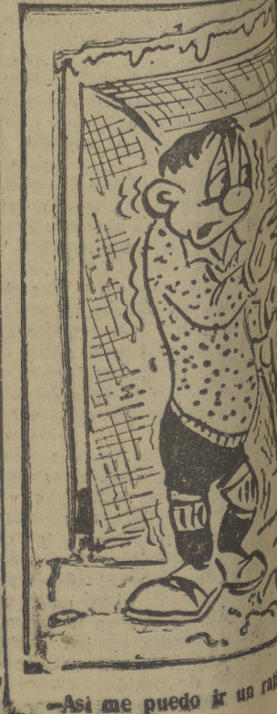
—Así me puedo ir un...