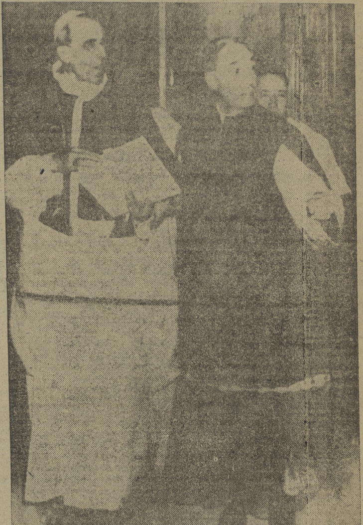
Su Santidad el Papa, Pio XII, acompañado del prefecto de Ceremonias, monseñor Enrico Dante, a su llegada a la sala donde se celebró el Consistorio Secreto. -- (Foto Cifra U. P. -- Recibida por radio)

Recibidos con el protocolario ceremonial de las grandes solemnidades de diplomáticos en el Palacio de Oriente, pasarán a la capilla, juntamente con el Jefe del Estado y todas las representaciones de los altos organismos estatales. Allí tendrá lugar la solemne ceremonia.