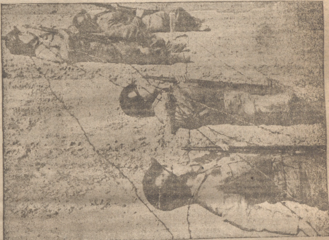
Soldados sudcoreanos se entrenan en el uso de alambres para poder entrar pronto en acción

En la sede de las Naciones Unidas se ha informado que Cuba ha acusado a la Unión Soviética del secuestro de tres mil niños españoles, a los que prepara con objeto de utilizarlos más tarde en la propaganda comunista en Iberoamérica. La delegación cubana ha puesto de relieve el cuadro dantesco en que se desenvuelve la vida de estos niños, ya hambres.