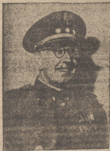
Ha llegado a Barcelona, en avión, procedente de Barajas, el ministro de Industria, don Carlos de Argillo, para asistir a diversos actos y visita de factorías.

Y por encima de esto, España ha mantenido en alto la bandera de una pacífica y respetuosa consideración hacia el pueblo indígena, facilitándole los medios adecuados de su elevación cultural, sin prejuicios racistas, en un ambicioso y cristiano deseo de salvación de hombres para el Imperio espiritual hispánico que quería la mejor reina de Castilla.