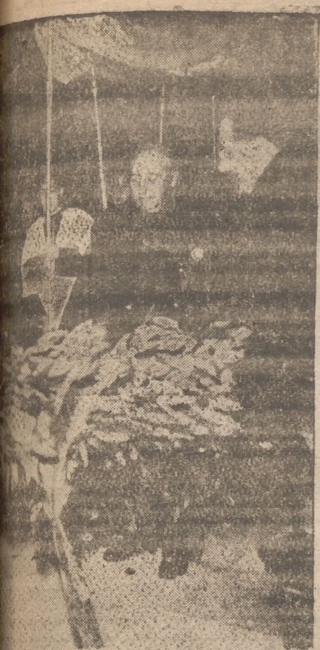
El jefe del Estado en el momento de depositar sobre la tumba del Fundador la corona transportada a hombros desde Madrid a El Escorial

(Referencia completa de lo tratado en el Consejo de Ministros, en última página)