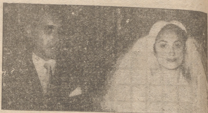
Nuevo estado, inició viaje nupcial con dirección a San Sebastián, Barcelona y Baleares, fijando su residencia en Murcia.

La feliz pareja, a quien deseamos toda clase de venturas en el