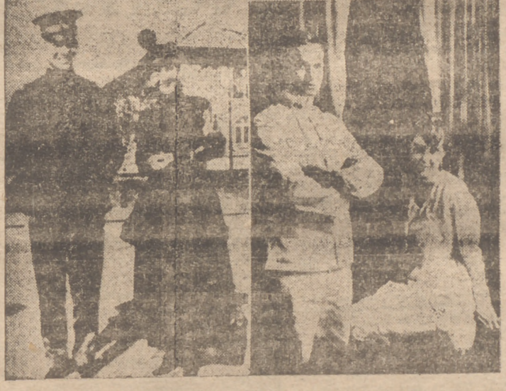
Cuatro estampas distintas de la vida del nuevo presidente de los Estados Unidos. — Eisenhower, cuando era cadete en West Point, por el año 1912. — El general con pintoresco atuendo durante la campaña definitiva. — Abajo, Eisenhower recibe en la Academia la visita de su novia, con la que aparece en la otra escena a los tres días de su matrimonio.