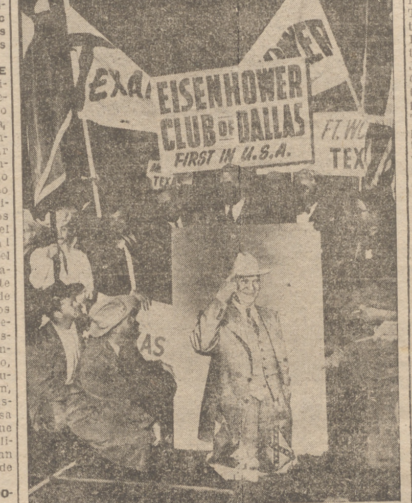
Eisenhower ha cuidado especialmente su propaganda electoral en el Estado de Texas, intentando introducir una curia en el Sur demócrata. En la foto vemos a un grupo de partidarios de "Ike" llevando carteles y pancartas con gigantescas fotografías por las calles de Dallas.

cuando los candidatos presidenciales salen de las convenciones de su partido, estudian detenidamente el mapa de los Estados Unidos y la cantidad de electores que cada uno de ellos tiene en cada uno de los Estados.