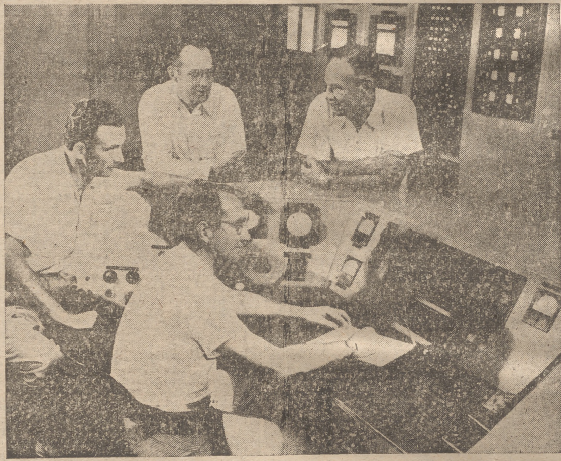
He aquí cuatro de los hombres que en Norteamérica están encargados de la aclaración de los informes sobre los "platillos volantes".

espacio, pero no el punto de origen. De las otras 29 Lunas conocidas en Sistema Solar no hay ninguna que reúna condiciones de vida. TEORÍA DE LOS COMETAS ¿De un cometa? Estos hijos pródigos del Sistema Solar han sido objeto de superstitión humana desde que el hombre bajó de los árboles para andar en dos pies. Pero aparte de asustar a las viejas y ser un grandioso espectáculo en una noche sin luna, los cometas son cosas bastante insignificantes. La cabeza suele estar formada por una colección de rocas que se mantienen juntas por atracción de gravedad mutua. Y en cuanto a la cola, su formación es tan difusa que ha llegado a decirse que hay más sustancia en un centímetro cúbico de brisa marina que en cinco mil kilómetros cúbicos de cola de cometa. LAS CLASES DE VIDA ¿De otra clase de vida? No hay razón ninguna para asumir (Pasa a séptima página)