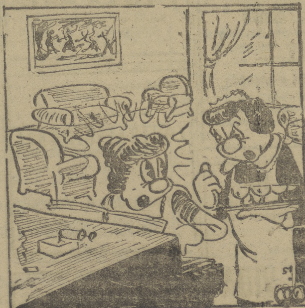
—¡Ya le dije yo, señorita, que hacía calor aquí...; todos se han ido a la terraza...!