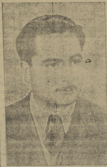
(Amplia información en la página tercera del desarrollo de las elecciones del domingo).