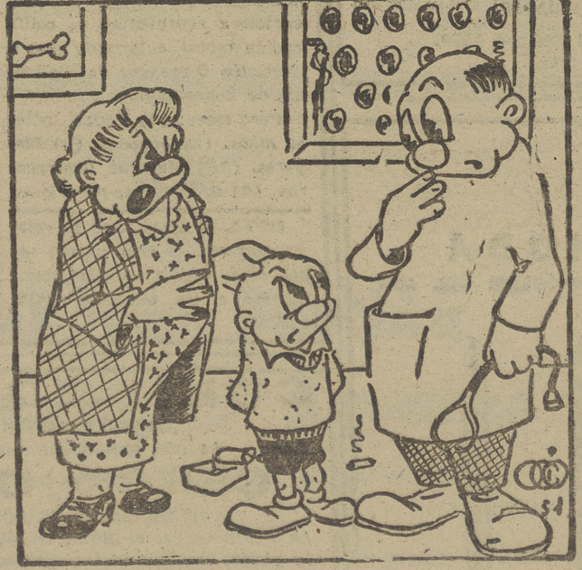
—¡Tanto darle cal, tanto darle cal..., que ahora se nos quiere hacer arquitecto...!