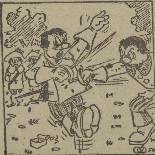
—¡No vale clavar tanto, porque vamos a pinchar a los de atrás...!