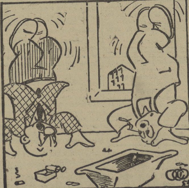
—¡Nos la ha hecho usted "parda" con interpretar los planos al revés...!