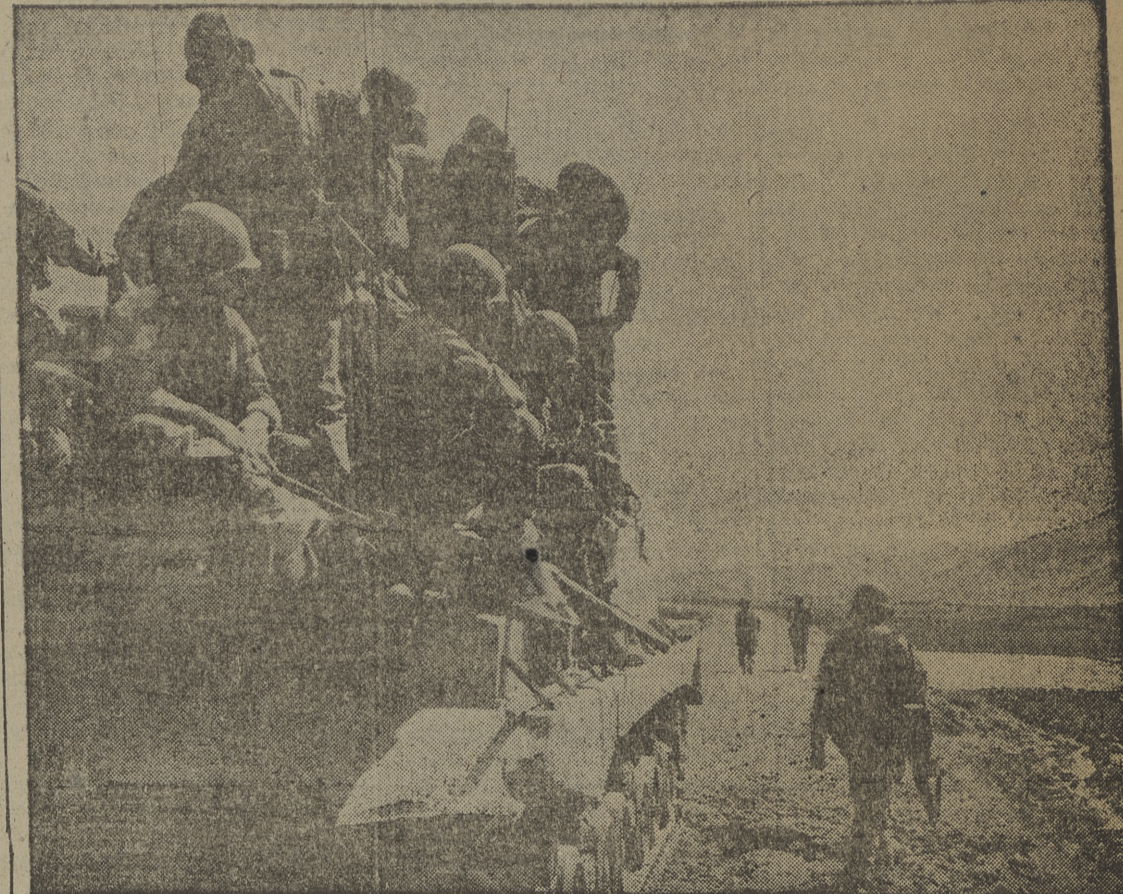
Tanques americanos cargados de hombres del 27 regimiento, vistos en una carretera persiguiendo a los comunistas chinos en el frente central de Corea, en el que aquéllos han penetrado en el territorio norteamericano en un frente de 27 millas.

Una patrulla estadounidense llegó hasta la ciudad de Yanggu