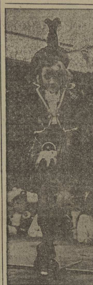
Chiquillos de todo el país han ocurrido en el concurso de los Juegos Caledonianos en Londres. Aquí algunos pequeños de Leicester

Los norteamericanos van a prestar a los portugueses una ayuda definitiva y poner toda la carne en el asador, como dice la frase castiza, para que el Ejército lusitano alcance una potencia desconocida hasta la fecha. Los portugueses, desde los círculos más humildes a los altos centros políticos, hablan con entusiasmo de que el Ejército portugués alcanzó plenamente la confianza de los Estados Unidos, los cuales van a equiparlo con la atención y cariño que dedican a sus propias fuerzas.