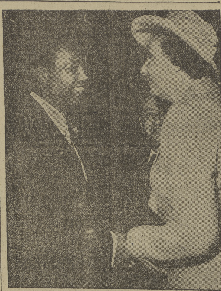
Diez mil dólares contra el cáncer. El campeón mundial Ray Robinson entrega a Mme. Aurio, esposa del presidente francés, un cheque de diez mil dólares...