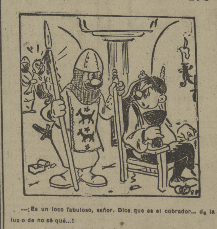
—¡Es un loco fabuloso, señor. Dice que es el cobrador... de la luz o de no sé qué...!