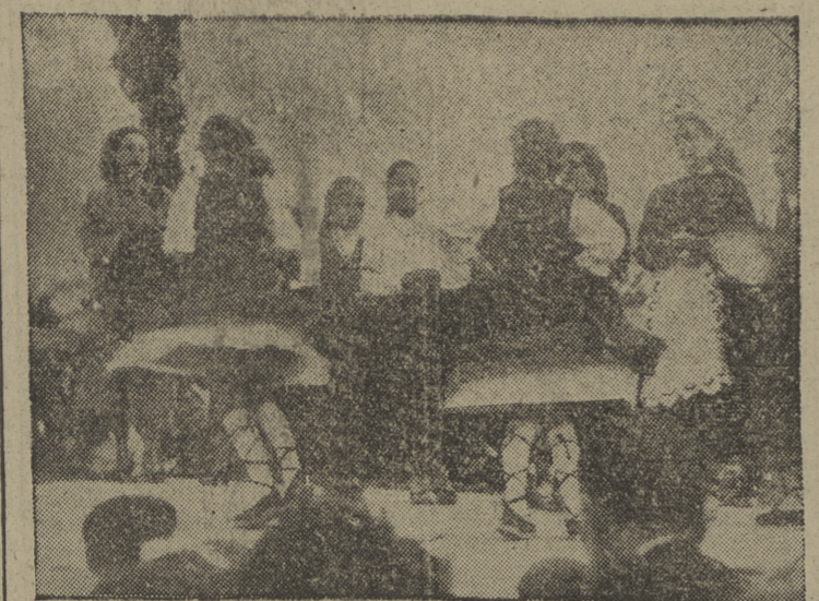
He aquí un momento de la fiesta celebrada en la Merindad de Valdivielso con motivo de la entrega, por la Caja Municipal de Ahorros, de material a las escuelas de aquel municipio. — Información en páginas interiores.