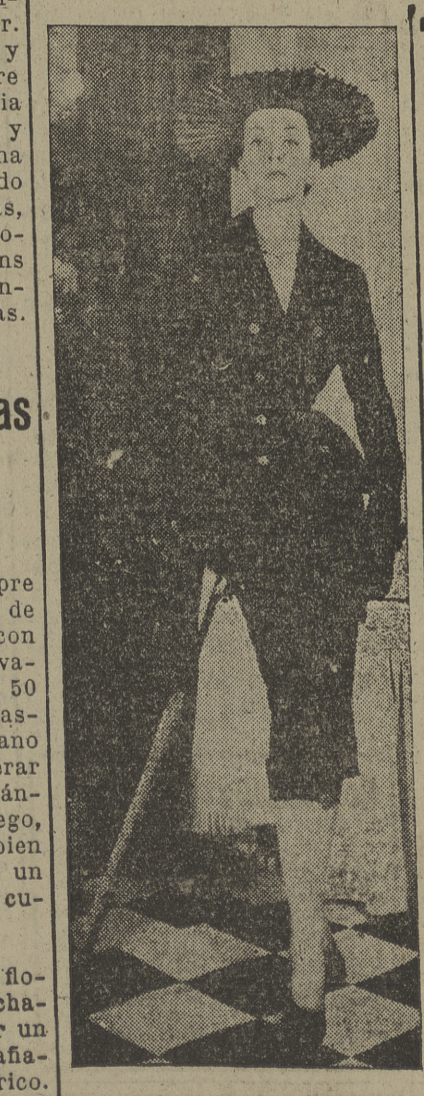
He aquí uno de los últimos modelos lanzados por las casas de modas de París.

JUANITA. — Las manos te blanquearán si eres constante en aplicarte por la noche aceite y limón batido y dejas durante el sueño que haga efecto sobre las manos, para