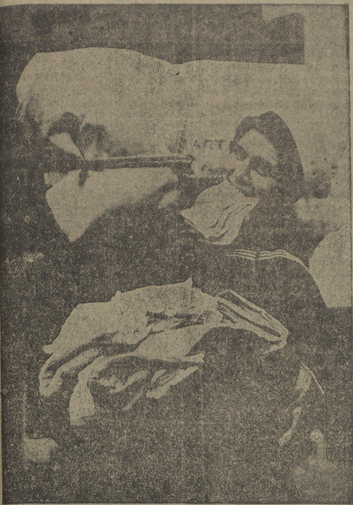
Uno de los 300 reservistas de la Marina Inglesa que se han incorporado en la base de Portsmouth para ser destinados inmediatamente a las unidades que partirán para Oriente, con su equipo, a cuevas y cinco libras de "bounty" en las dietas, se dirige al puesto asignado.