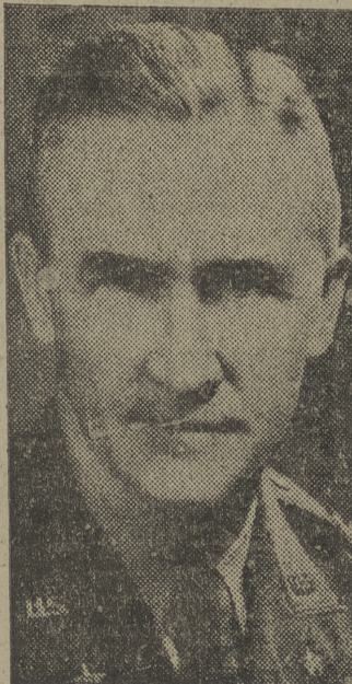
El general de División Edmond H. Leavelle, del Ejército norteamericano, que ha sido destinado al Estado Mayor del general Eisenhower