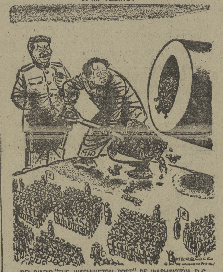
DEL DIARIO "THE WASHINGTON POST", DE WASHINGTON, D. C.