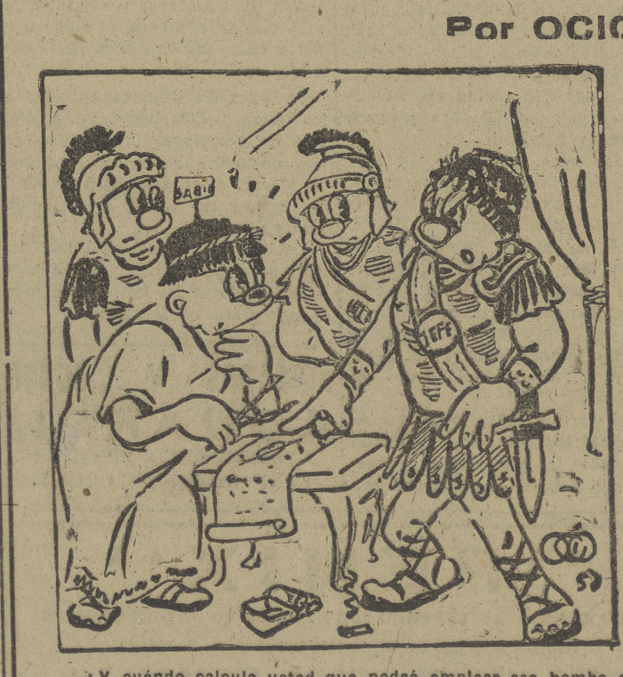
¿Y cuándo calcula usted que podrá emplear esa bomba atómica...?