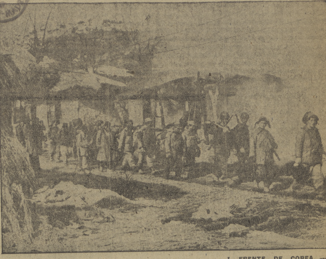
FRENTE DE COREA. — Las fuerzas norteamericanas han conseguido avanzar, pese a la tenaz resistencia comunista, y han ocupado unas alturas situadas al Norte de Hengchon. Las últimas noticias que llegan de este sector indican que los chinos han lanzado a la lucha nuevas reservas y han sido identificados elementos de los ejércitos chinos 39 y 40. La ciudad de Pungam, antiguo Cuartel General de los rojos, ha caído, atacada en tres direcciones por fuerzas de la Infantería de Marina de los Estados Unidos y británicas. La censura del VIII Cuerpo de Ejército no ha permitido la identificación de las fuerzas que tomaron Hengchon.