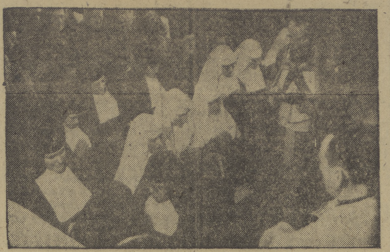
Ayer, en el convento de las MM. Misioneras del Calvario, tuvo lugar la toma de hábitos de tres novicias, así como los votos, por un año, de tres madres y el voto perpetuo de otra. Impuso los hábitos el P. Eliseo, del Seminario de Misiones Extranjeras.

Acaso tenga algo que ver con el humorismo — aunque, por otra parte, nos parece una iniciativa bastante seria — esa nueva industria dedicada a la venta de legumbres cocidas que acaba de ser inaugurada en la capital de España. En una amplia nave de cerca de veinte metros de larga por diez de anchura se alinean veinte grandes cocinas, donde las legumbres se cuecen bajo la vigilancia de expertas cocineras elegantemente uniformadas. Las judías, los garbanzos, las lentejas, se venden ya guisadas y cocidas, es decir, a pedir de boca. Gracias a esta original industria madrileña no hay temor a que se estropee el cocido. Con ello se resuelve el problema doméstico de la mujer que trabaja en oficinas y talleres. No supone esta industria, al fin y al cabo, una gran conquista de la civilización al servicio del feminismo, la liberación de las amas de casa de la tiranía del fogón?