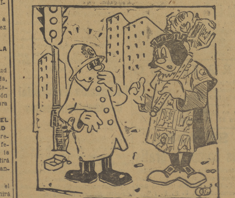
—¿Ha visto usted al Ayuntamiento de Burgos...?