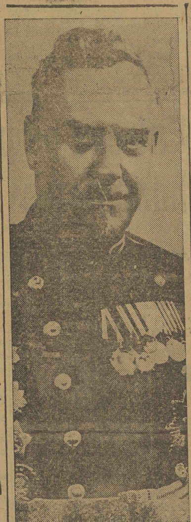
Este hombre cargado de medallas y de gesto marcial y duro es el mariscal Bulganin, primer ministro adjunto de la U. R. S. S. Se dice que debido a sus méritos y radicalidad va a ser nombrado "Jefe de Operaciones Atlánticas", lo que equivale al "Eisenhower de Moscú"

La Institución tiene un presupuesto anual de ochenta y ocho millones