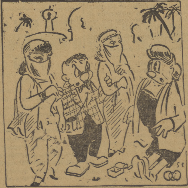
—¡Mujer... son recuerdos de Bagdad!