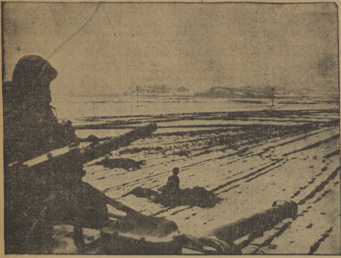
Soldados americanos hacen hoyos en el suelo cubierto de nieve en el frente coreano, para después hacer frente a la avalancha china en el sector de Suwon. Tanques vigilan para proteger la acción de los improvisados zapadores.