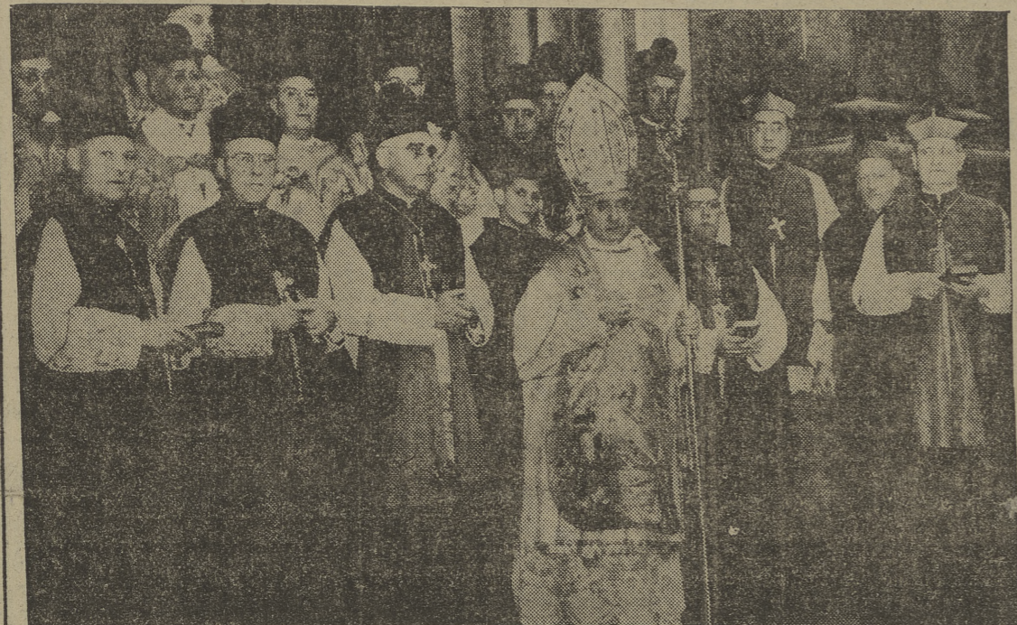
El cardenal arzobispo de Nueva York, monseñor Spellman, rodeado de 16 obispos norteamericanos, en las puertas de la catedral de San Patricio, después de la solemne misa celebrada para conmemorar el centenario de la fundación de la archidiócesis neoyorquina.

MADRID, 14. — La Comisión Sindical Central remolachero-azucarera se ha reunido en el Sindicato Vertical del Azúcar para proponer al ministro de Agricultura las bases de ordenación de la campaña 1951-52. La Comisión entiende que es de absoluta necesidad adoptar cualquiera de las determinaciones siguientes: 1. Libertad de precios de la remolacha azucarera, con la consiguiente libertad de precio y de comercio del azúcar y de los subproductos de su transformación (alcohol, pulpa seca, etc.). De adoptarse este régimen, habría de garantizarse a la industria la seguridad de su mantenimiento durante toda la campaña de producción y venta 1951-52, limitándose la intervención estatal, cuando más, a vigilar la distribución de los productos, a fin de asegurar el normal abastecimiento de los diferentes mercados de consumo. 2. Elevación del precio de la remolacha hasta ochocientas pesetas por tonelada métrica como mínimo, con la necesaria reposición en la tasa del azúcar, bien estableciendo un precio único para toda la producción de este artículo, o fijando el de una parte de ella y dejando en libertad de comercio el resto, o atribuyendo a éste un precio superior al del destinado al consumo de boca. (Cifra.)