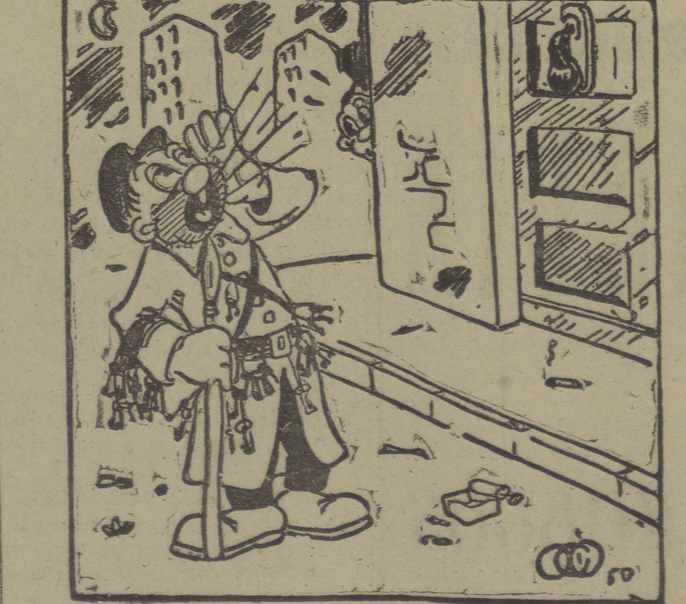
—¡Fellissaa...! ¡Echame la llave...!