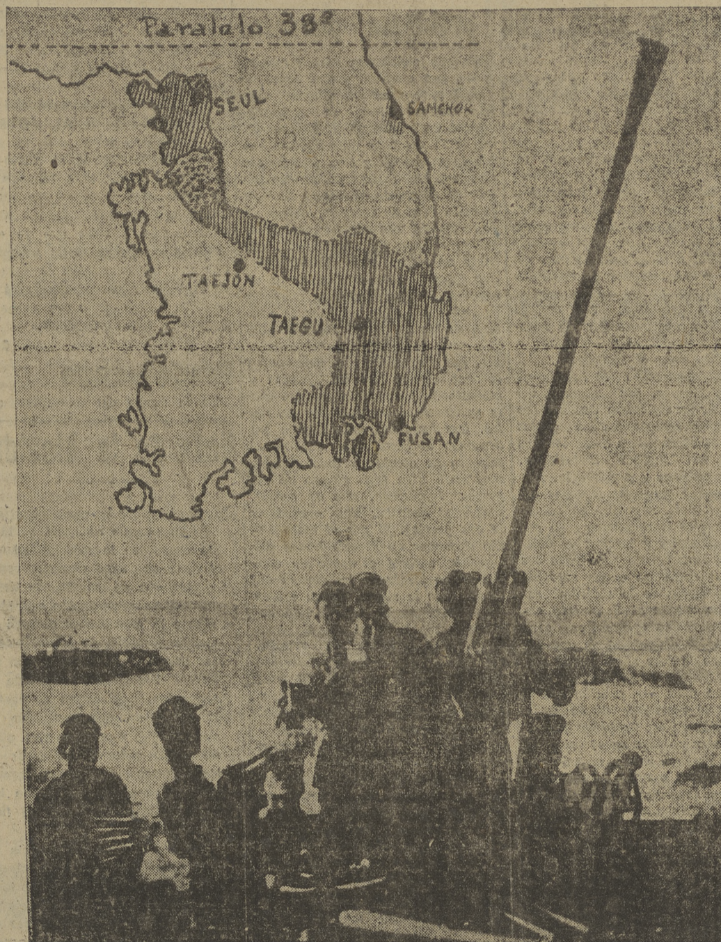
Una pieza anti-aérea de fabricación rusa es manejada por artilleros nortecoreanos para repeler posibles ataques de la aviación estadounidense contra las instalaciones de Pyongyang. Esto desvirtúa la inocencia que los rusos achacan a la guerra coreana, que como verdaderos lectores por el gráfico, está a punto de liquidarse. El espacio de rayas en el mapa corresponde a la situación el martes. Los puntos señalan la zona de contacto realizada ayer, dando lugar al desmoronamiento del frente Sur.

TOKIO, 26. — "SEUL HA SIDO LIBERADO Y EL ENEMIGO HUYE A LA DESBANDADA HACIA EL PARALELO 38", ANUNCIA EL GENERAL MAC ARTHUR EN UN COMUNICADO TRIUNFAL. (EFE.) DECISION EN DIEZ DIAS TOKIO, 26. — EL CUARTEL GENERAL DEL DECIMO CUERPO EN COREA, PUBLICA EL SIGUIENTE COMUNICADO: "TRES MESES, DIA POR DIA DESPUES DE QUE LOS COREANOS DEL NORTE LANZARON SU ATAQUE CONTRA EL SUR DEL PARALELO 38, LAS TROPAS DEL DECIMO CUERPO HAN CONQUISTADO LA CAPITAL DE SEUL. EN EL CURSO DEL BREVE PERIODO DE DIEZ DIAS, UNIDADES DE LA INFANTERIA DE MARINA, NORTEAMERICANA, AUMENTADAS POR TROPAS SURCOREANAS, DESEMBARCARON SOBRE LAS PLAYAS DE INCHON Y EMPRENDEDIERON RAPIDAMENTE EL CAMINO HASTA ESTE IMPORTANTE CENTRO DE COMUNICACIONES, CORTANDO ASI LA LINEA DE ABASTECIMIENTO VITAL PARA EL ENEMIGO." (EFE.)