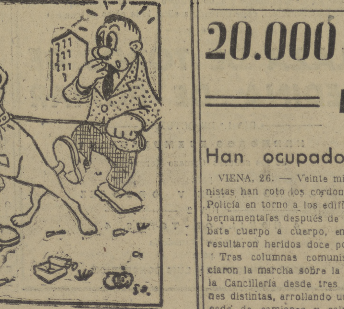
— ¡No tengas miedo, Perico, que no muer... (?)!