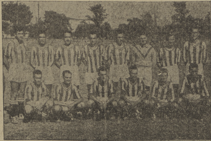
Equipo de balonmano de la Milicia Aérea Universitaria

Si brillante fué la primera jornada de atletismo con la que se inició el gran festival deportivo entre la Milicia Aérea Universitaria y la Sociedad Deportiva Arlanza F. J., las pruebas del domingo fueron digno colofón.