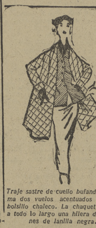
Traje sastre de cuello bufanda. Forma dos volúes acentuados con un bolsillo chaleco. La chaqueta tiene a todo lo largo una hilera de botones de lanilla negra.

Según el Pandit Nehru, precisamente Corea es la manzana de la discordia futura chino-rusa: Corea está en peligro de ser absorbida por la U. R. S. S. como antes Manchuria, y a China la solivianta semejante aspiración.