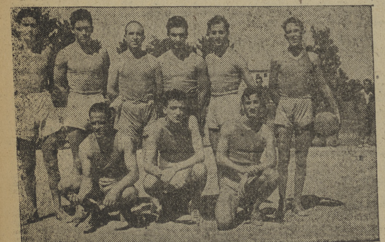
Conjunto de baloncesto del Arlanza F. J.

En la prueba de más confianza la Milicia, pues posee unos buenos elementos, que demostraron bien su clase, pero los burgaleses no se amilanaron y supieron dar la batalla y hasta pudo haberse resultado el "match" a su favor. Inos virajes muy lentos truncaron las posibilidades de los