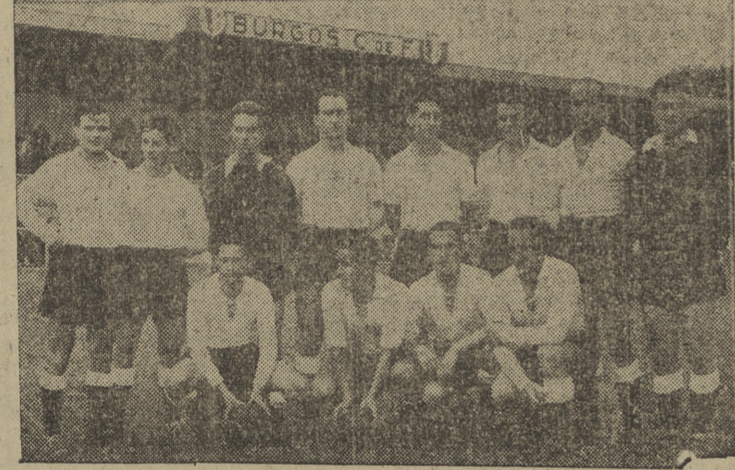
Ha comenzado ese gran torneo deportivo que es la Liga. Modestamente, Burgos también participa en una competición oficial. Este es el equipo local que inauguró la temporada en Zatorres.

Fué diecisiete veces ministro y tres presidente del Consejo. Encontró siempre tiempo para las letras oratorias político-jurídicas más brillantes.