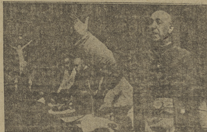
Tres aspectos de la solemne ceremonia de inauguración del nuevo Seminario Español de Misiones Extranjeras.