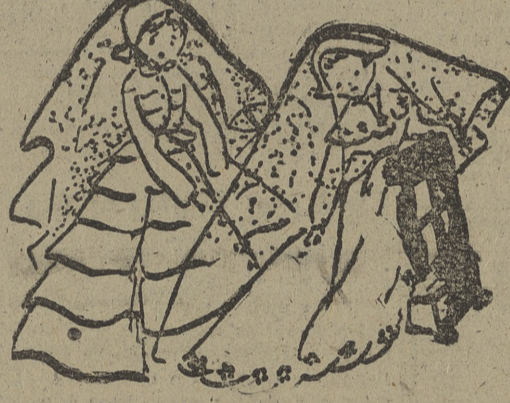
Tal es la imagen grotesca de lo que pasa en las células de nuestro organismo cuando éste vejece.

Si se admite el coeficiente de Buffon, la vida media del hombre debe llegar a los 150 años. ¿ES LA VEJEZ UN MAL INCURABLE? Para Bogomoletz, aquel que vive 155 años, como el campesino Khepera Klont, vive una vida normal. Lo anormal, biológicamente, es morir a los 80 años, por ejemplo. Y todos aquellos que mueren antes de la cifra tope del hombre no tanto lo deben a la vejez como al concurso de una serie de circunstancias desfavorables, tales como la enfermedad, el agotamiento, etc.