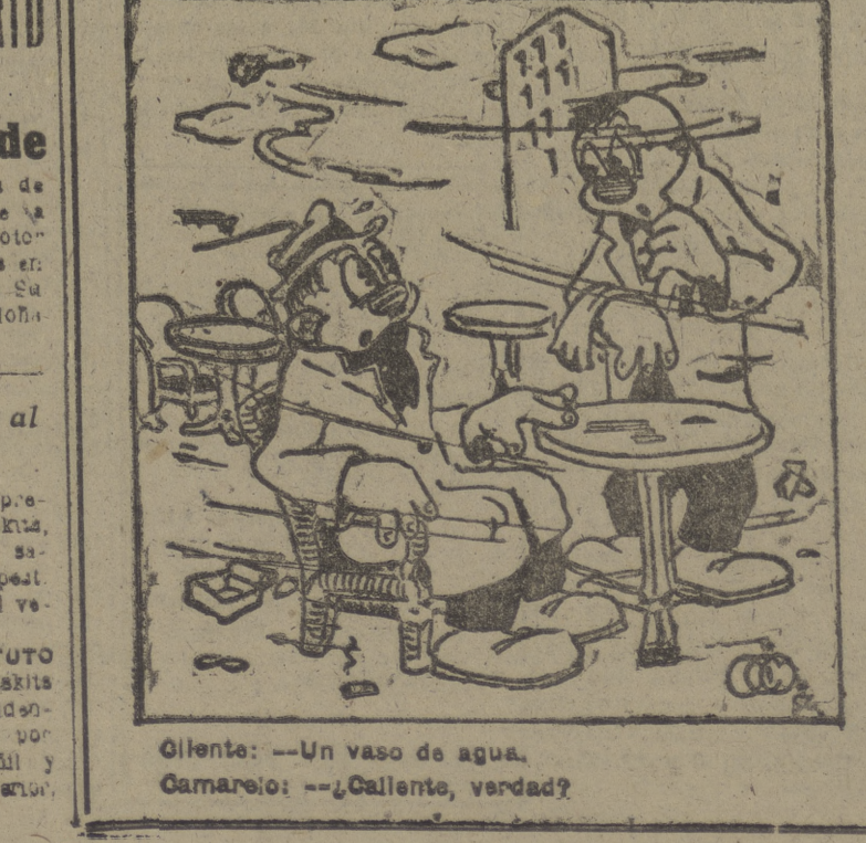
Olivento: —Un vaso de agua. Camarero: —¿Calleño, verdad?