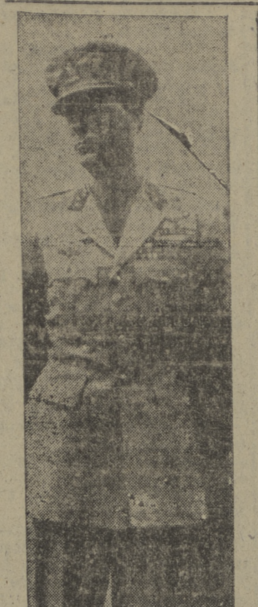
El príncipe Bernardo de Holanda, a su llegada a Río de Janeiro en viaje de buena voluntad, revista a los soldados de Aviación que le rindieron honores.

En su campaña electoral, los laboristas prometieron seguir adelante con la nacionalización de las industrias del cemento, de la carne y posiblemente de las químicas. (Efe.)