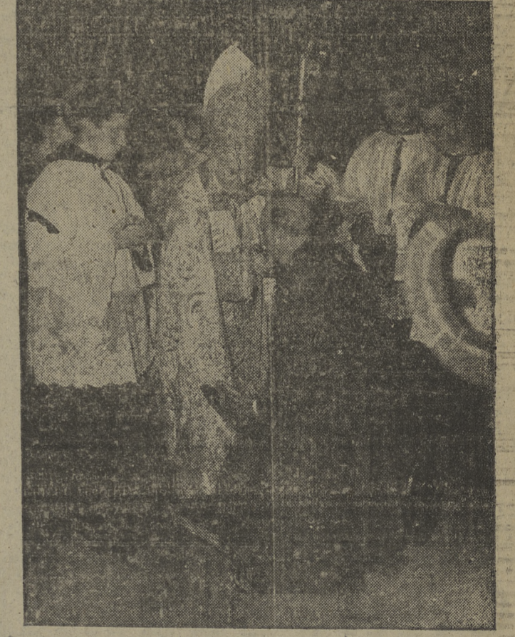
Su Excelencia el Jefe del Estado asiste al solemne funeral organizado por el Gobierno en memoria de S. M. el rey don Alfonso XIII, en el Escorial. En la fotografía, el obispo de Madrid-Alcalá recibiendo al Caudillo a la puerta del Monasterio.