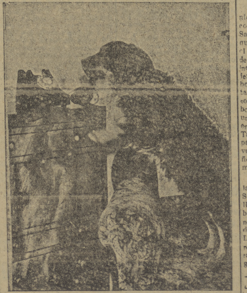
A este perro pastor, "Byrn" se llama, le entusiasma descolgar por sus dueños el teléfono. Con un ladrido responde, sorprendiendo un poco a los que desconocen el sistema, pero haciendo saber que tienen que aguardar un poco, pues el dueño de la casa está ocupado.