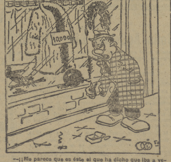
— ¡Me parece que es éste el que ha dicho que iba a venir mañana a comprar!!