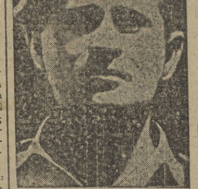
He aquí al capitán Paul Westerling, holandés, que al mando de un ejército de guerrilleros, compuesto de aventureros y desertores, ha declarado una guerra abierta a la nueva República de los Estados Unidos de Indonesia.

YAKARTA, 27. — Tropas indonesias han interrumpido el paso de dos mil rebeldes que avanzaba hacia Yakarta. Un portavoz ha manifestado que los rebeldes que originaron un encuentro de dos horas en el centro de la ciudad durante el día de ayer, eran parte de las tropas de vanguardia enviadas a ésta para originar desórdenes. (Efe.)