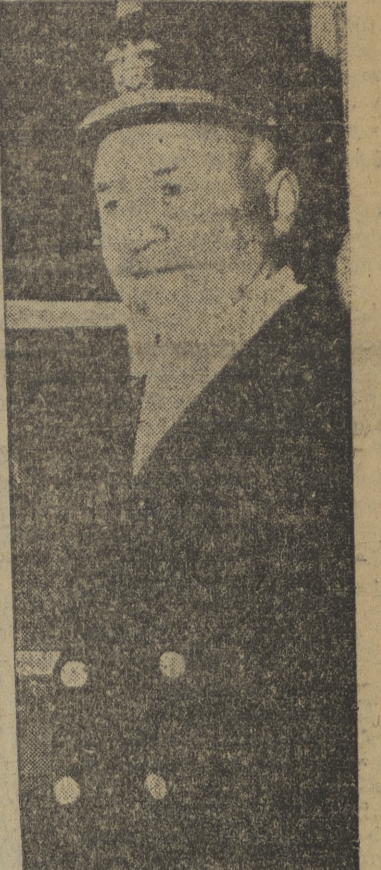
El almirante Forrest P. Sherman, jefe de operaciones navales norteamericano, a su llegada a la Casa Blanca para conferenciar con el presidente Truman sobre asuntos militares desconocidos.

El líder socialdemócrata Schumacher denuncia los propósitos franceses FREIBURGO (Zona francesa de Alemania), 27. — "Alemania Occidental debe rechazar la idea de una Europa unida si los derechos del pueblo del Sarre a definir su futuro son negados", ha declarado el doctor Kurt Schumacher, jefe de los socialdemócratas, en un discurso pronunciado en una reunión de su partido. Añadió que Alemania tampoco puede aceptar que las minas y los ferrocarriles de la citada región pasen a manos de los franceses durante varias décadas. "Son propiedad de la República Federal Alemana — dijo — y no de la camarilla de Sarrebruck. Sólo el Gobierno de Bonn puede decidir en esta cuestión." (Efe.)