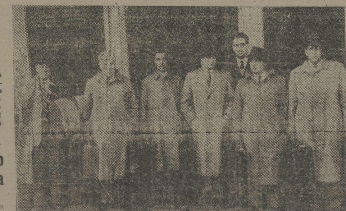
El capitán y los oficiales del "Monte Gurugu", con los apoderados de la casa consignataria en Pasajes de la Compañía Naviera Aznar, a su llegada a Irún, después del naufragio frente a las costas de Inglaterra.