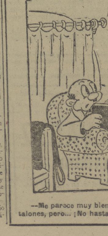
--Me parece muy bien que cuides de la raya de tus pantalones, pero... ¡No hasta ese extremo...!