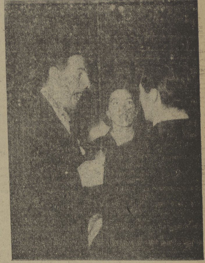
El actor Steward Granger (izquierda), junto a la actriz norteamericana Eva Gardner, chillaba hasta desgañitarse para pregonar la bonanza del restaurante "Las Sendas", que en Hollywood han abierto Esther Williams y su esposo