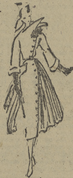
El modisto parisino Jacques Fath, presenta en su exposición de otoño un modelo asimétrico en lana de distintos colores.