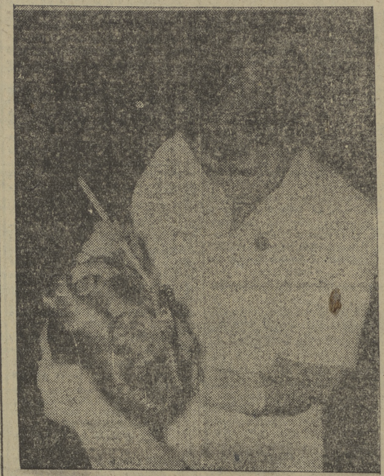
La ganadora de un concurso de aprendizas de peinado da los últimos toques a este artístico peinado.

Anteayer, fiesta de carnaval aquí, fué día de grandes diversiones y alegrías y ayer, día de Todos los Santos fué de grandes lutos al producirse al mediodía en este aeropuerto la mayor tragedia de aviación en la historia de Norteamérica con un balance de cincuenta y cinco muertos. A esa hora, todas las ambulancias, todos los servicios de bomberos, todos los "reporters" periodísticos y una multitud de cinco mil personas se hallaban congregados en la zona del edificio de Correos donde acababa de producirse la explosión de un transformador, incendiando el edificio e hiriendo a siete personas cuando la catástrofe aérea sobreviniera a corta distancia al chocar en el espacio un caza boliviano nuevo y en pruebas, contra el de pasajeros que procedente de Nueva York se disponía a aterrizar arrojándole un ala de la cola, cayendo el caza en el río Potomac, que atraviesa esta ciudad y el de línea en la orilla.