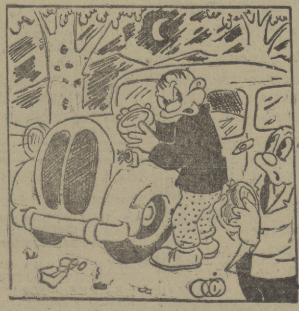
—No sé por qué le extraña que le obligue a quitar un farol. No sabe usted que cuando se cruzan dos coches es obligado el "cambiar" de luces?

Centenario del Instituto Catastral MADRID, 2. — En los salones del Instituto Geográfico y Catastral se ha celebrado la solemne sesión conmemorativa del I centenario de su fundación. Presidió el acto el ministro de Industria y Comercio, señor Suárez.