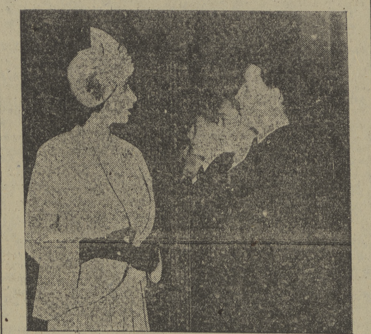
La princesa Isabel revista a una guardia de honor formada por cadetes de la Academia Naval de Greenwich, a su llegada al Kingsway Hall de Londres, para asistir a una reunión en honor de la Marina inglesa.