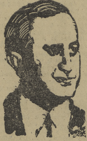
Eurico-Gaspar Dutra, presidente de los Estados Unidos del Brasil, a quien se ha concedido el Gran Collar de Isabel la Católica.