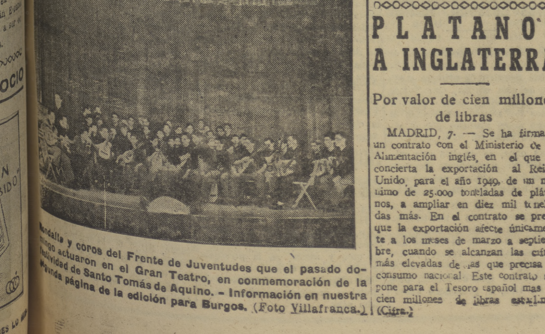
Bandas y coros del Frente de Juventudes que el pasado domingo actuaron en el Gran Teatro, en conmemoración de la fiesta de Santo Tomás de Aquino. — Información en nuestra página de la edición para Burgos.