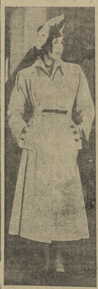
Magnífico abrigo para la ciudad y el campo, hecho de tejido fuerte, espigado en diagonal, presentado en una exposición en el Café París, de Londres.

TRUMAN, DE VACACIONES En la soleada costa, todavía tan española, él meditará si Grecia debe o no ser abandonada para complacer a estos comunistas, futuros combatientes contra Norteamérica al lado de los soviets, según espontánea y anticipada declaración de sus compañeros de partido, aunque la oposición de Truman, a su respecto, quedó bien clara cuando hace dos días declaró en la conferencia de Prensa que se negaba a hacer comentarios sobre traidores.