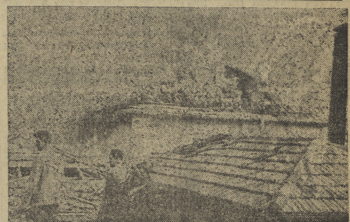
Reportaje gráfico de nuestro fotógrafo Villafranca del incendio ocurrido ayer en las instalaciones industriales "Loste". (Información en cuarta página.)