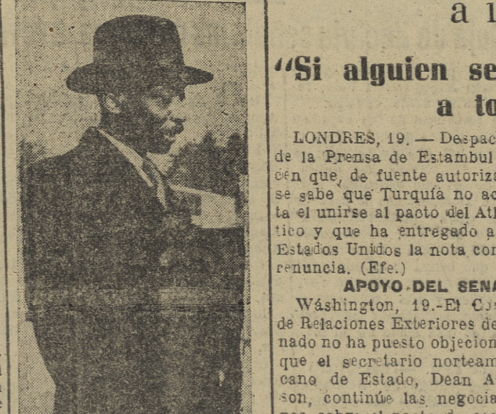
El coronel Gatixto, inspector diplomático de Haití en Europa, que el viernes estuvo en Burgos, camino de Madrid, donde realizará la apertura del Consulado de su país en España.

MADRID, 19. — El príncipe Muley el Mehdi ha hecho entrega esta mañana al Municipio madrileño de una leona que su alteza imperial le regaló al Zoológico.