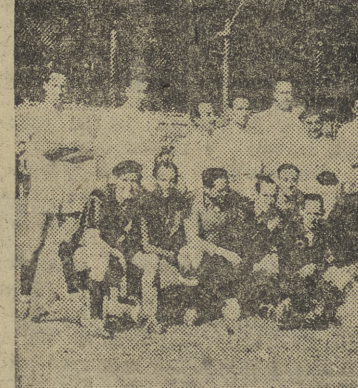
Equipos de oficio es del Regimiento de Caballería que ayer jugaron en Zatorre un encuentro amistoso.