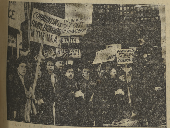
Más de un millar de católicos neoyorquinos mostraron su indignación por la vil condena impuesta al cardenal Mindszenty. En la "foto", los protestantes elevan una oración al Señor por el infortunado purpurado húngaro.

Terminada la visita, el general Valero pronunció unas palabras, expresando su satisfacción por la visita. PALABRAS DEL JEFE DEL ESTADO El jefe del Estado pronunció las siguientes palabras: «Felicitó a la Sanidad Militar»