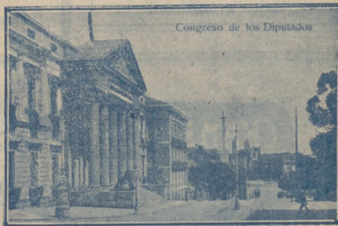
Congreso de los Diputados.—Madrid