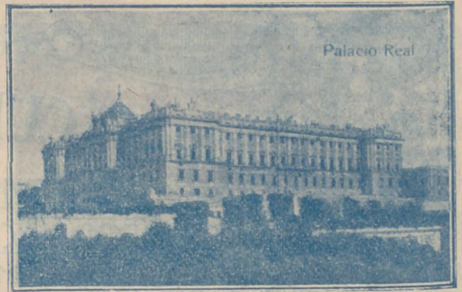
Palacio Real, de Madrid