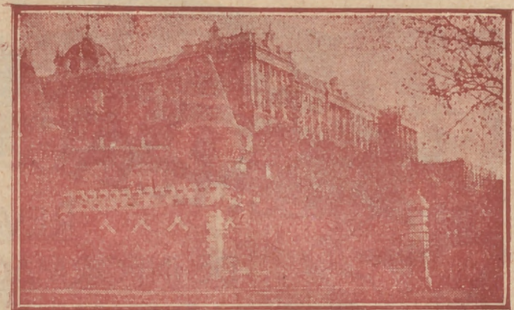
Palacio Real, de Madrid