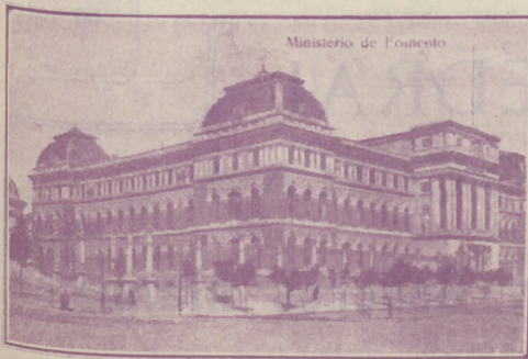
Ministerio de Fomento