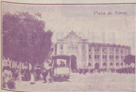
Plaza de Toros