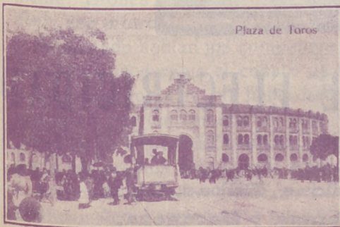
Plaza de Toros