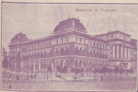
Ministerio de Fomento