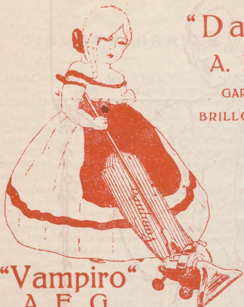
"Vampiro" A. E. G. LIMPIA TODO SIN TRABAJO ALGUNO