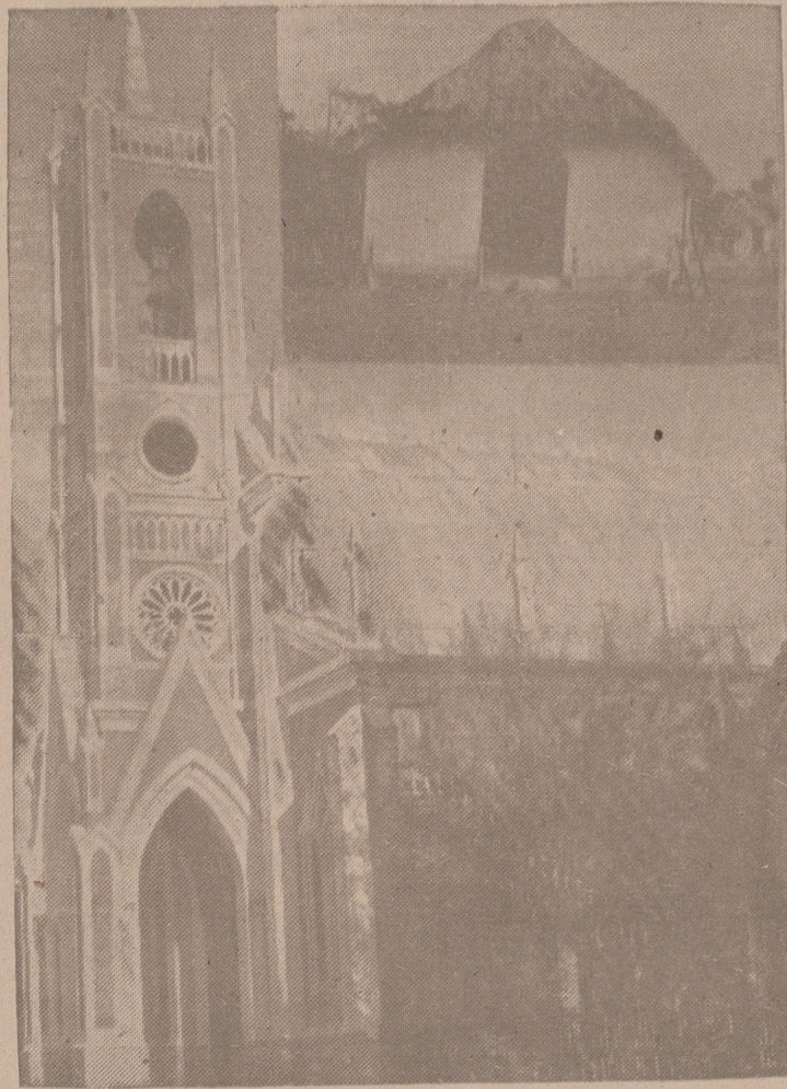
En la parte superior de la fotografía, la primera iglesia levantada por los misioneros del Seminario de Burgos. Con su esfuerzo y trabajo manual lograron levantar esta sencilla y elegante iglesia que aparece en la parte inferior y que es la mejor de la Misión.

Y es de esperar que el resurgimiento de la nueva España por la que luchan voluntarios desde el día primero de la contienda 37 alumnos, de los treinta que tiene el Seminario, y que eran los únicos y todos los que por su edad estaban dispuestos a empuñar las armas, recobre la Patria el impulso misionero que la glorificó más que todos los triunfos a lo largo de su Historia incomparable.