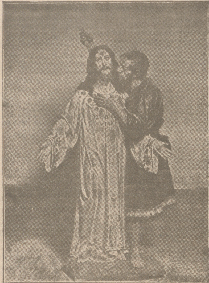
El beso de Judas

PARA EL ALUMBRADO DEL TABERNACULO, de 4 días de duración, fabricada con sujeción al CANON 1271 del vigente Derecho Canónico, que dice así: «Delante del Tabernáculo en que se reserva el Santísimo Sacramento, brille una lámpara continuamente día y noche, alimentada con aceite de oliva o cera de abejas». ¡LIMPIEZA ABSOLUTA! ¡TRANQUILIDAD COMPLETA! Precio de cada lámpara 1 peseta. Id. del Vaso de cristal y Rejilla, 3 (Se venden en cajas de a 24 lámparas). VITORIA (España) Hijo de Quintín Ruiz de Gauna DE VENTA EN BURGOS: Almacenes de Ultramarinos LA PROVEEDORA — SAN JUAN, 63