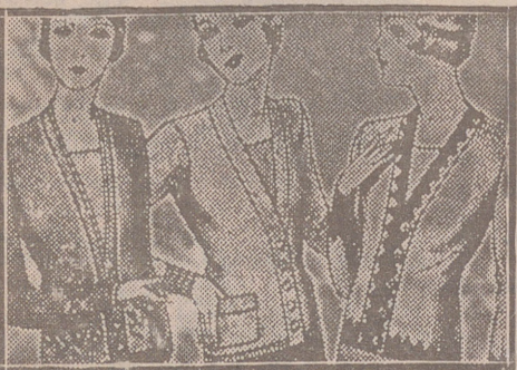
Blusas charquetillas, de 7, 8, 10, 12 y 15 ptas.