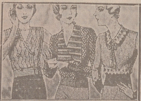
Blusas punto novedad, a 5, 6, 8, 10 y 12 ptas.