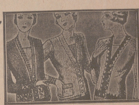
Blusas chaquetillas, de 7, 8, 10, 12 y 15 ptas.