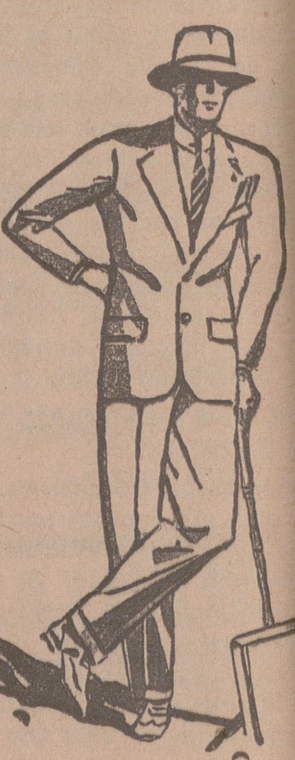
Trajes de paño, confección fina, de 60, 70, 80, 100 y 120 pesetas. GRANDES SURTIDOS