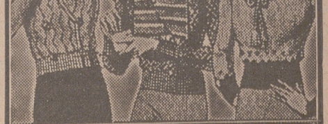
Blusas punto novedad, a 5, 6, 8, 10 y 12 ptas

Primera casa en confecciones para caballero, señora, jóvenes y niños. Tejidos, Pañería y Sastrería