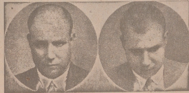
12 años calvo 10 meses después curado

De nueve a una mañana y de dos a ocho tarde, visitará, gratuitamente y a domicilio, avisando previamente a dicho HOTEL, Instituto J. Mourade. Barcelona. Ramba de las Flores, 4. 1.º. En Madrid, Fuencarral, 15. SISTEMA DE APLICACION PARA LA CURACION RADICAL Y RAPIDA