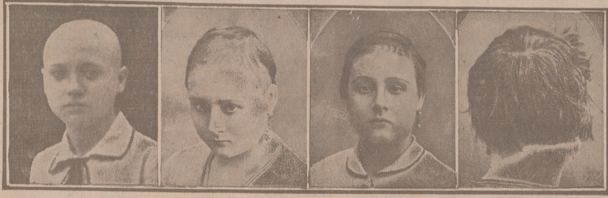
14 años 5 meses 8 meses 12 meses

El inventor del CAPILAR J. MOURADE, 65.000 cartas afirman la eficacia, 150.000 casos curados en el mundo entero, reconocidos por las autoridades españolas y extranjeras. universalmente conocido por sus maravillosas curas (muy conocido en España por haber curado una infinidad de casos rebeldes de calvicie), estará el JUEVES, VIERNES Y SÁBADO en esta ciudad, en el HOTEL PARIS, donde recibirá las consultas de los interesados en su maravilloso específico, exponiendo los casos curados, después de 30 años de calvicie.