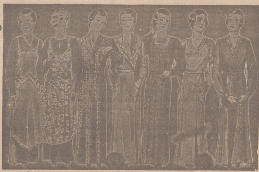
Vestidos, batas, kimonos de bañistas, percales o trovacos, de 7, 8, 9, 10, 12 y 14 ptas

Primera casa en confecciones para caballero, señora, jóvenes y niños. Tejidos, Pañería y Sastrería