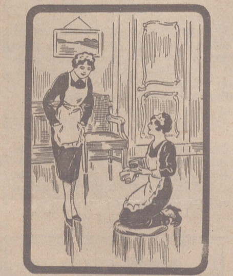
DA GUSTO VERLAS

Agradecemos el saludo que nos envía y gustosos correspondemos deseando al novel colega muchos años de vida.