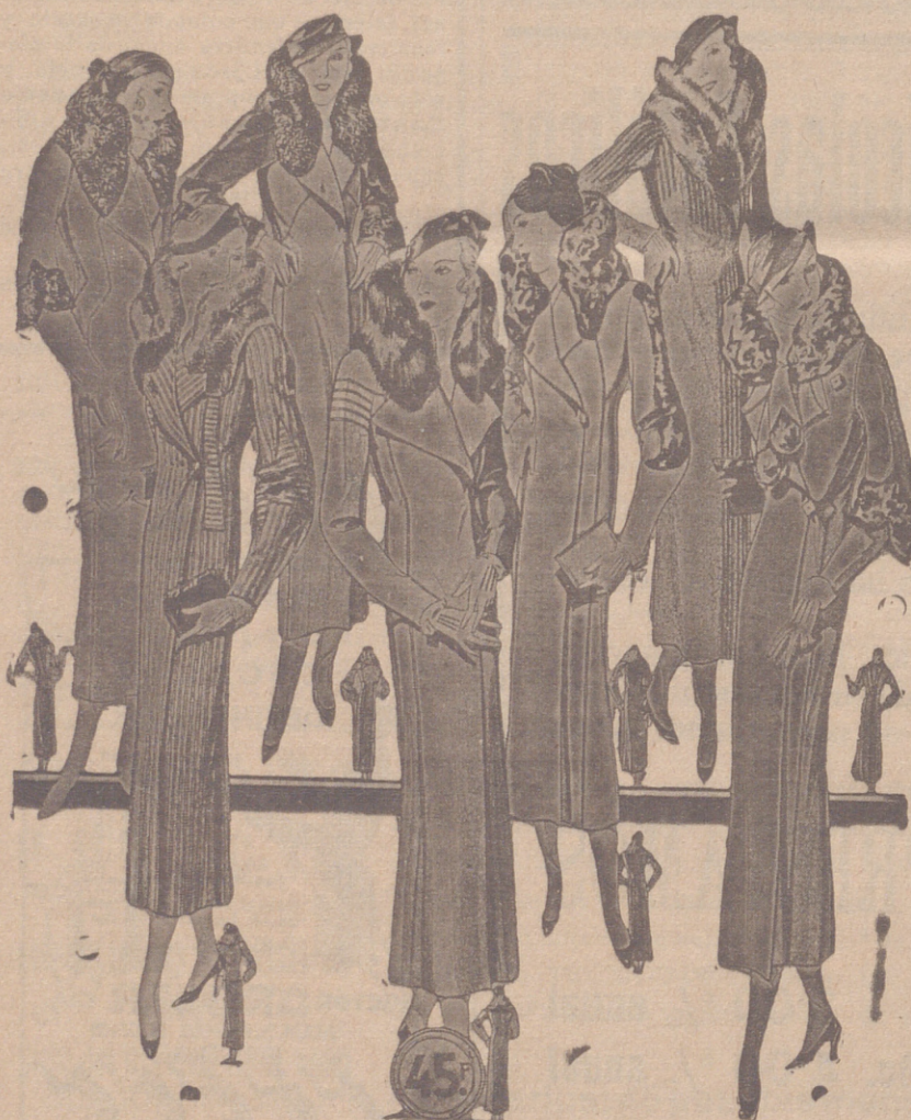
Abrigos señora, modelos novedad, a 20, 25, 30, 40, 50 y 60 pesetas. Abrigos para niñas, de 10, 12, 15 y 20 pts. LA CASA MAS SURTIDA Y MAS BARATO VENDE

Primera casa en confecciones para caballero, señora, jóvenes y niños Tejidos, Pañería y Sastrería