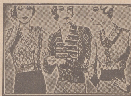
Blusas punto novedad a 5, 6, 8, 10 y 12 ptas.

Primera casa en confecciones para caballero, señora, jóvenes y niños. Tejidos, Pañería y Sastrería