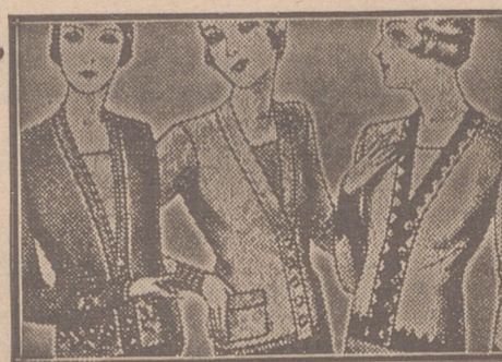
Blusas chaquetillas de 7, 8, 10, 12 y 15 ptas.