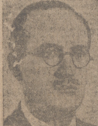
gente. Por primera vez en nuestra historia escolar la educación primaria habrá sido atendida en toda plenitud.»—Cifra.