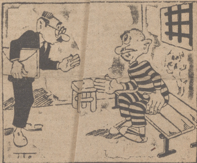
—Solo me quedan año más. —Bueno; pues... ¡iz año nuevo.