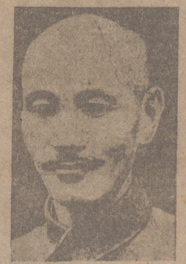
Nankín, 31. (Urgente).—En el mensaje de Año Nuevo, Chang-Kai-Chek anunció que abandonará, después de 21 años, la jefatura de la República de China, con el fin de abrir camino a posibles negociaciones de paz con los comunistas.

Una personalidad autorizada ha declarado que el Comité permanente del Poder Ejecutivo Central del «Kuomintang» será convocado en sesión extraordinaria para las ocho de la noche de hoy con el fin de dar su aprobación final a la decisión de Chang-Kai-Chek.—Efe.