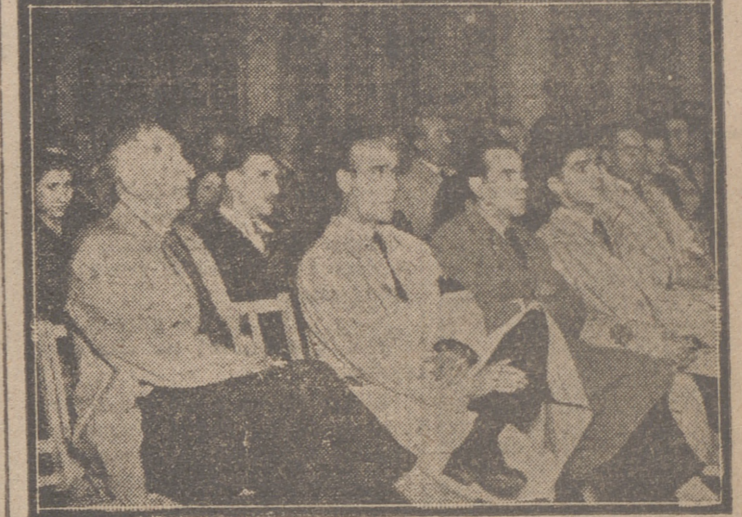
Un aspecto de la sala durante la conferencia